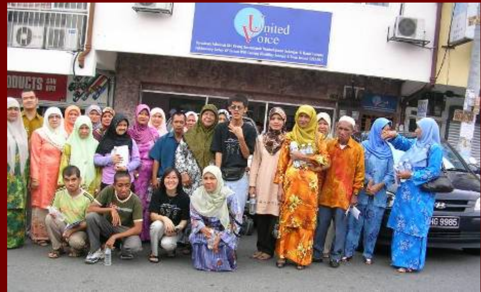
PDK Kg Chepa melawat United Voice 2009