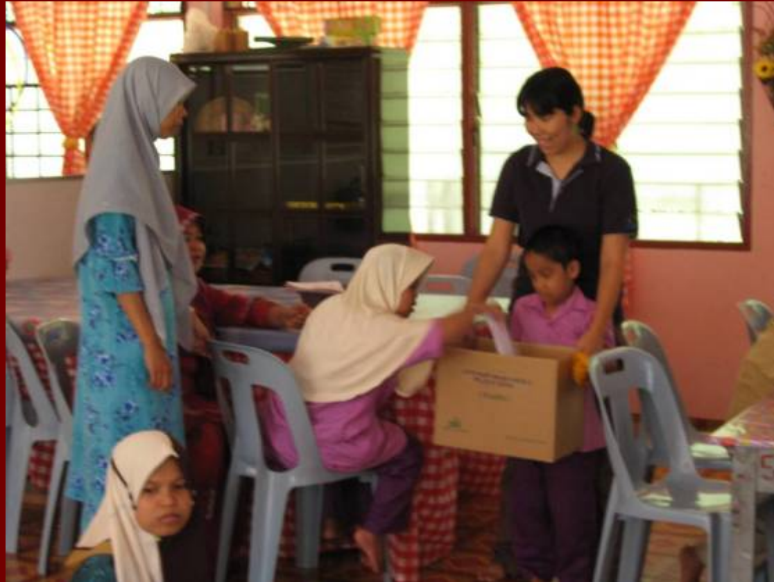
Masa pengundian Kumpulan Advokasi Diri PDK Peringat