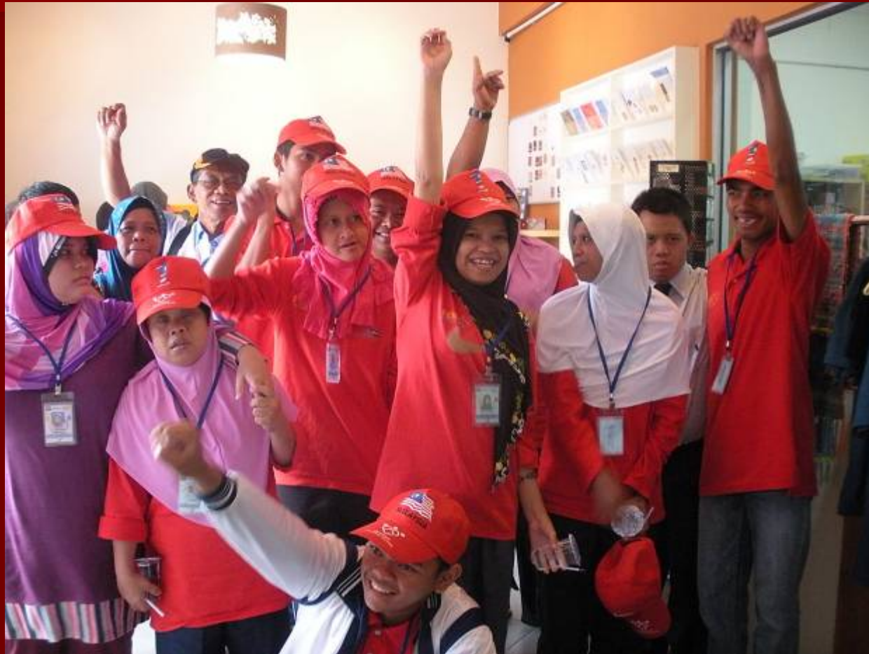
Kumpulan Nur Kasih dari PDK Peringat, Kelantan