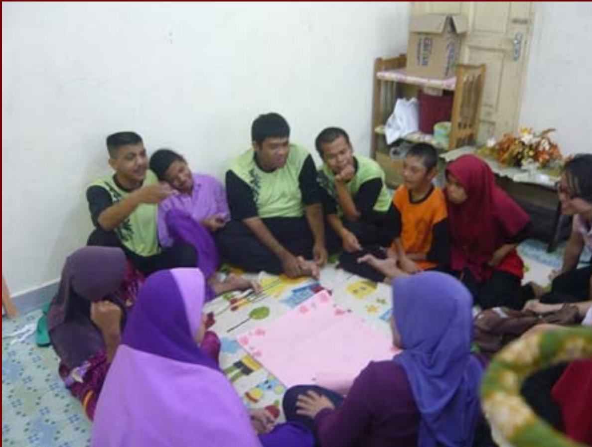
Penyokong memberi bantuan semasa mesyuarat