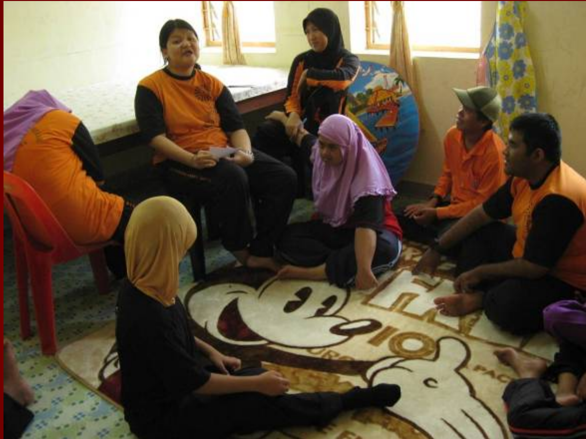
Mesyuarat Kumpulan Advokasi Diri Delima