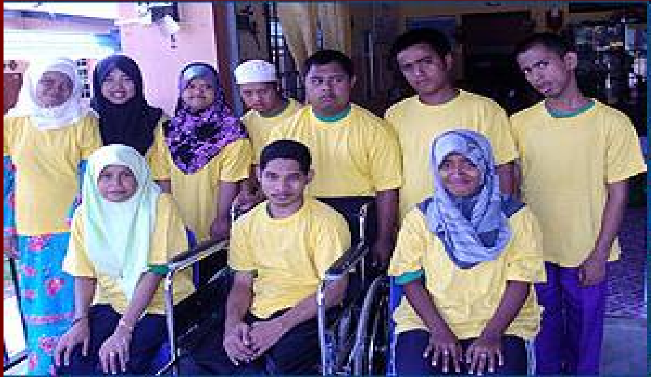
AJK Kumpulan Permata Hati