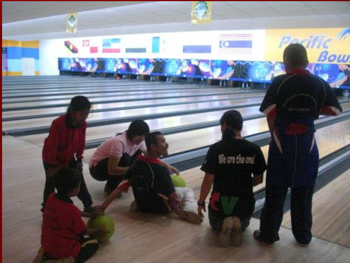
Kumpulan advokasi Seri Chepa pergi bermain bowling.