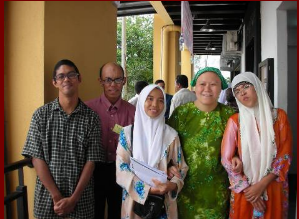
Kursus OKU Berdikari :Advokasi Diri dan Pekerjaan di Kelantan