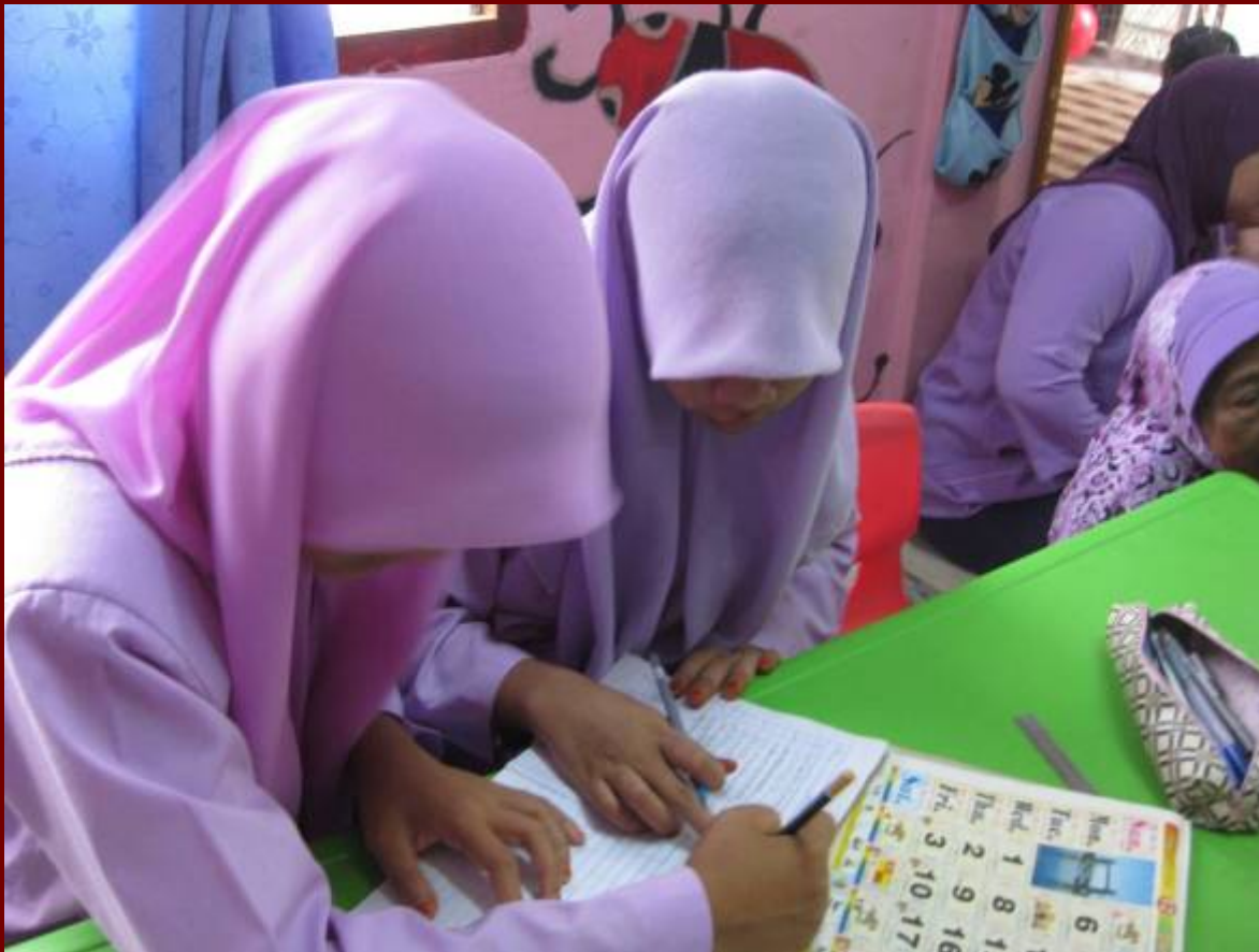
Mengira yuran kumpulan PDK Kawasan Guchil, Kumpulan Matahari