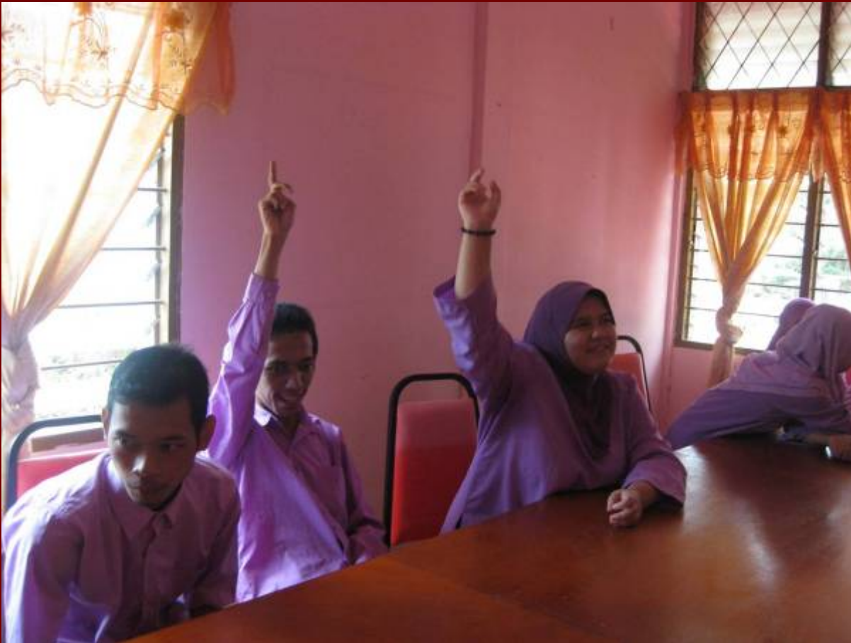
Mesyuarat Kumpulan Advokasi Diri PDK Kg Guchil