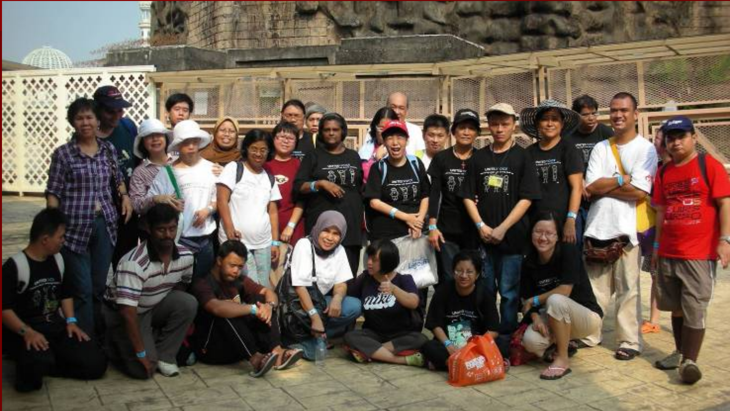
Lawatan ke Sunway Lagoon