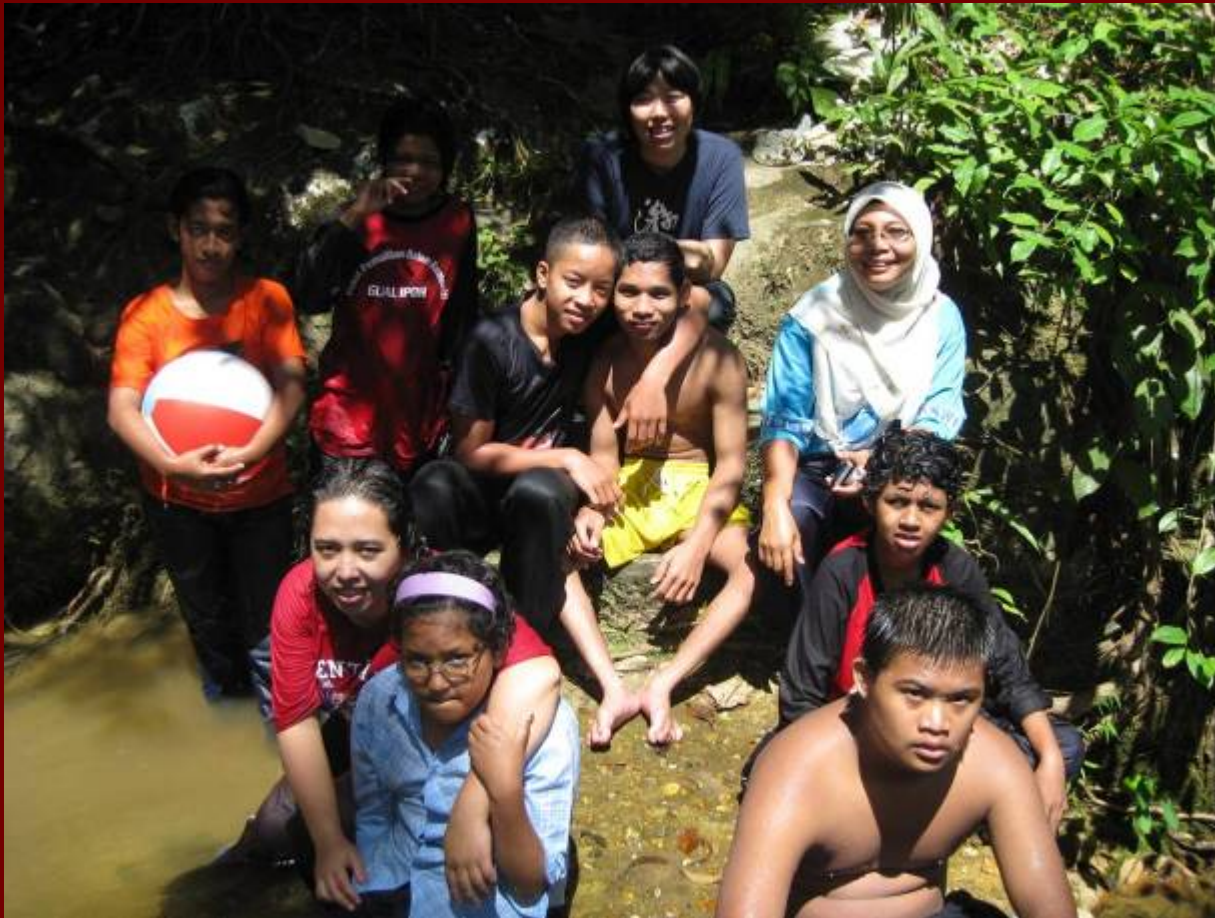
Kumpulan Permata Hati