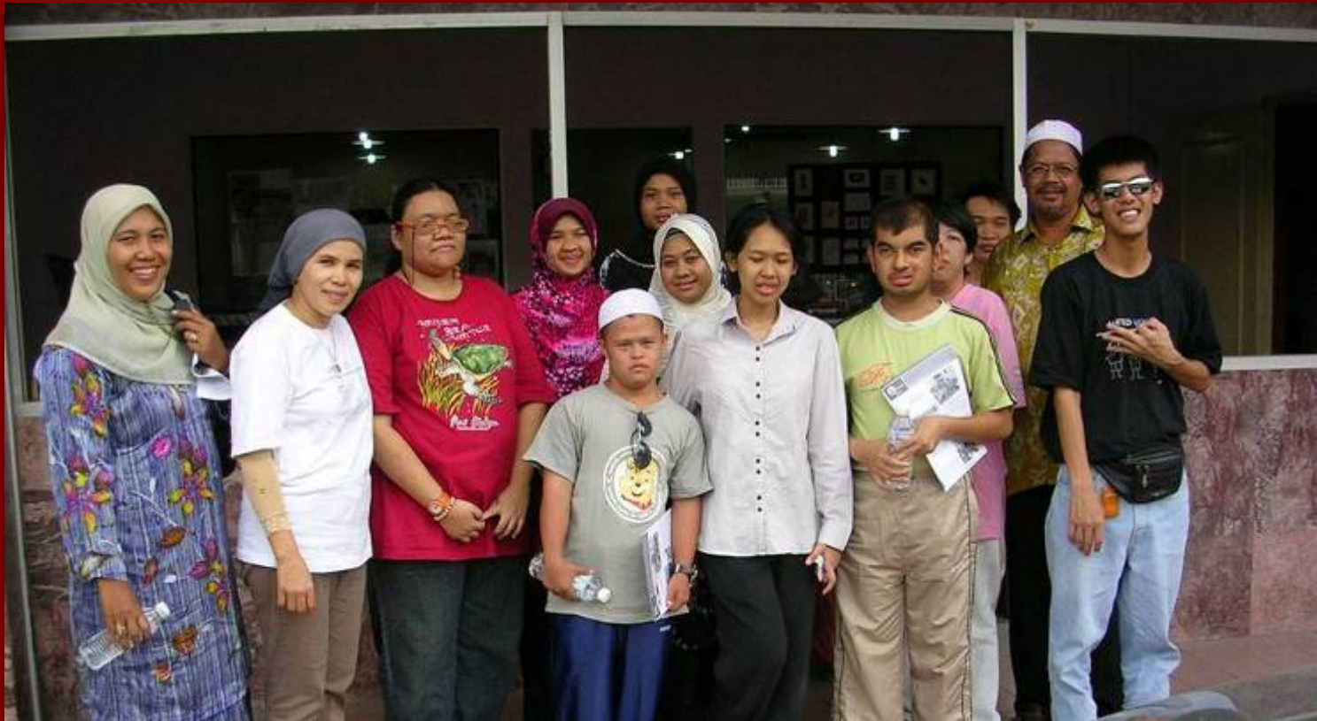
PDK Kg. Chepa melawat ke UV