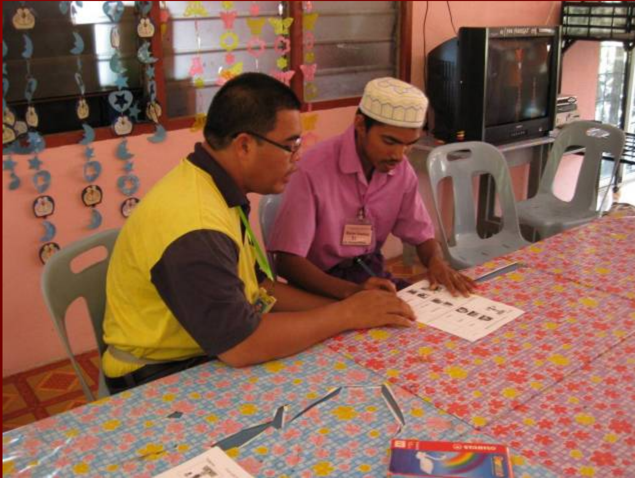
Pengundian Pelatih-pelatih PDK Peringat Kumpulan Nur Kasih