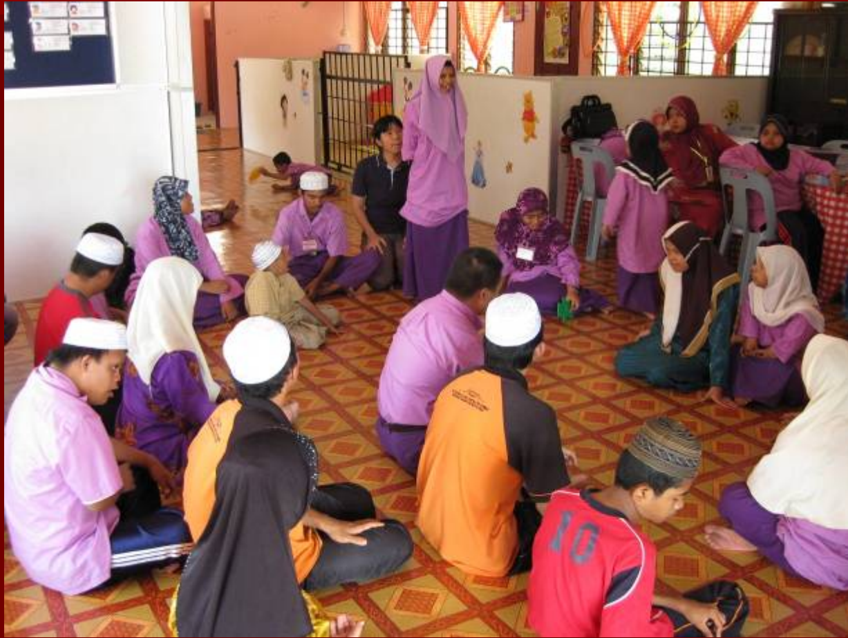
Kumpulan Nur Kasih di PDK Peringat bermesyuarat.