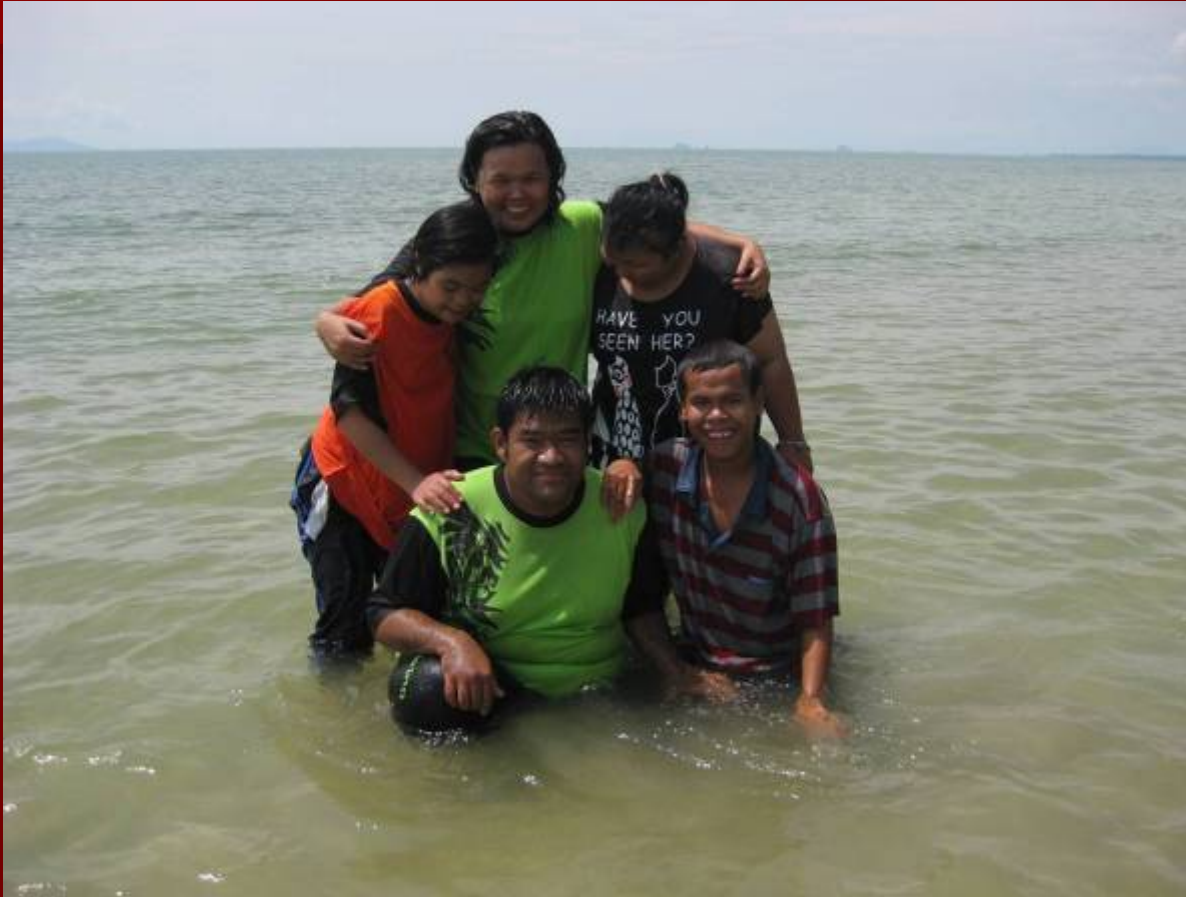
Pelatih PDK Bandar Tanah Merah