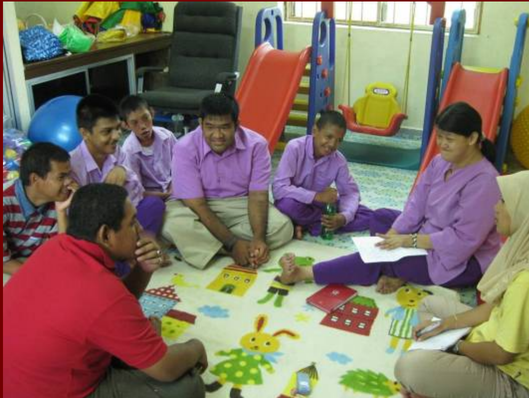
Mesyuarat Kumpulan Delima.